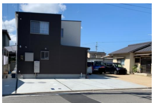
図面と現状が異なる場合、現状を優先します

特約 ・2年契約。自動更新 ・1年未満の解約の場合50%、1年以上の場合20%を差引くものとする ・退去時、ルームクリーニングを行い、その費用は入居者負担とする。 ・借主は町内会費について、自治会の指示に従い支払をするものとする。 ・浄化槽の汲取・点検費用は入居者の負担とする。また、退去時には入居者の負担にて浄化槽の汲取を行うものとする。 ・本建物内での喫煙は禁止とする。