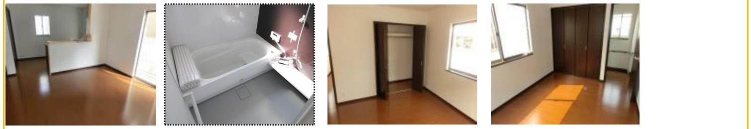
LDK バスルーム クローゼット 2F洋室