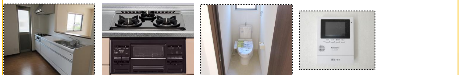
キッチン ガス(3口)コンロ トイレ 洗浄便座付 TVモニターホン